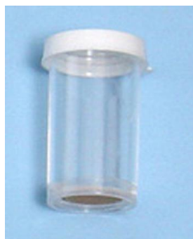
Figura 9: barattolo per la raccolta delle zanzare catturate con aspiratore elettrico.