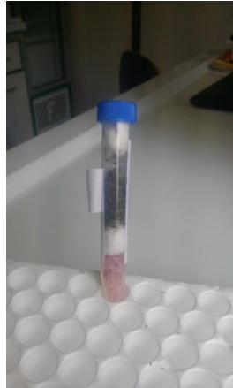
Figura 11: Falcon contenente insetti disposti tra 2 strati di cotone.

Gli insetti possono essere uccisi ponendo le retine in congelatore a -20^{\circ}\text{C} per almeno 15-30 minuti. In alternativa, qualora vi sia del ghiaccio secco residuo nel suo contenitore o nel thermos della CDC, i campioni possono essere riposti al loro interno: in tal modo gli insetti vengono uccisi e rimangono conservati congelati. Successivamente gli insetti uccisi vanno riposti in provette tipo Falcon, tra due strati di cotone idrofilo non eccessivamente pigiato (Figura 11). La provetta deve contenere per circa 1/4 del suo volume del gel di silice o altro dissecante per evitare la formazione di muffe. I due strati di cotone dovranno esser posti in maniera tale che i campioni non si muovano durante la spedizione perdendo i caratteri utili all'identificazione, ma senza che i due strati schiaccino i campioni stessi. I campioni devono essere etichettati (tipo di trappola, luogo e data) e accompagnati dalla scheda W05. Va utilizzata una scheda W05 per ogni data di cattura. Per data di cattura si intende la data della mattina in cui si raccolgono gli insetti.