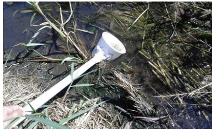
Figura 10: raccolta larvale mediante l'uso di apposito "pescalarve".

In alternativa, se le catture larvali sono effettuate con lo scopo di farle sfarfallare, raccogliere l'acqua con le larve in taniche che verranno chiuse con garze ed elastici (per consentire l'entrata di ossigeno). Una volta in laboratorio, mettere il contenuto delle taniche in vaschette coperte da reti a maglie sottili e aspettare che le larve sfarfallino. Una volta sfarfallate, aspirare gli adulti e procedere con la gestione del campione (zanzare adulte).