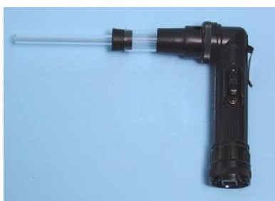
Figura 8: aspiratore elettrico.