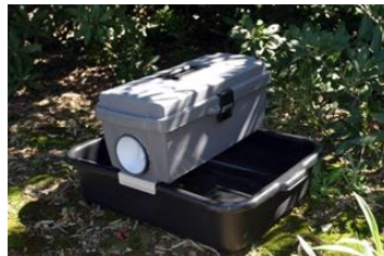
Figure 5: trappola Gravid assemblata e posizionata.