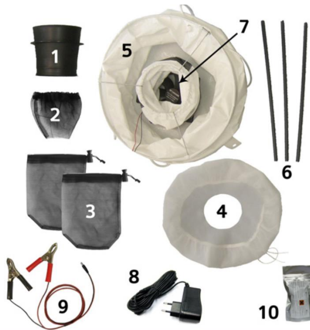
Figure 6: trappola BG-Sentinel non assemblata.

La trappola, la cui ventola può essere alimentata a corrente (220V) (8) o tramite batteria da 12V con appositi cavetti (9), deve essere posizionata a terra e deve rimanere in funzione per 24 ore dopo la sua accensione. È importante verificare la disponibilità di corrente elettrica.