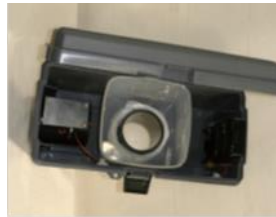
Figure 4: parte superiore della trappola Gravid assemblata.