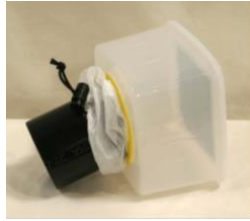
Figure 3: contenitore per la raccolta degli insetti e tubo di aspirazione assemblati.