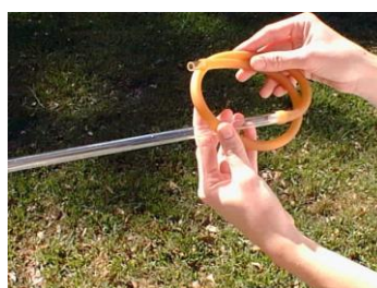
Figure 7: aspiratore a bocca.